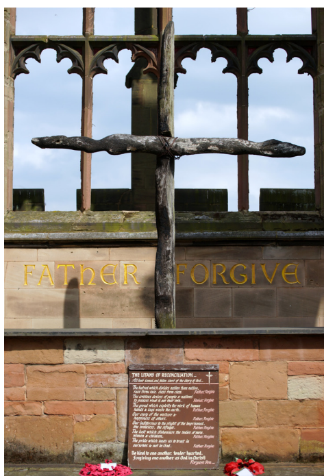
Blick zum Altar in der Ruine der Kathedrale von Coventry