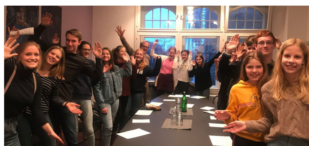
Jugendliche Teilnehmende aus Lübeck, Bildrechte Robert Pfeifer

Lübeck: Vom 14. bis 17. März 2019 fährt Pfarrer Robert Pfeifer mit 20 Jugendlichen aus Lübeck nach York und Coventry. Neben den jetzigen Konfirmanden sind auch etliche Ehemalige dabei – allen ist bewusst, dass sie sich mit englischen Jugendlichen über eine Versöhnungsarbeit austauschen, die immer wichtiger wird. Dabei geht es nicht nur um Schuld, die unsere Vorväter auf sich geladen haben, auch nicht darum, Geschehenes wieder gut zu machen. Das geht nicht. Aber man kann Zeichen setzen – für die Zukunft. Junge Menschen engagieren sich gegen Ausgrenzung, gegen Menschenrechtsverletzungen, Gewalt und vor allem Krieg. Und dabei werden sie nicht Trübsal blasen, sondern gemeinsam singen, lachen, sich anfreunden und dennoch den Ernst ihres Anliegens nicht vergessen.